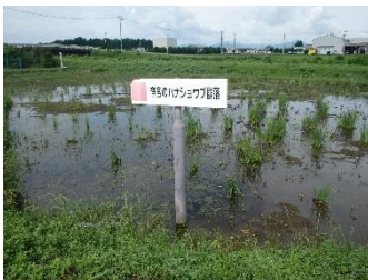
指定地の様子(令和2年6月)