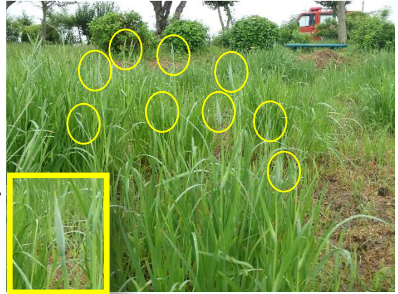
(令和3年5月19日撮影。○が蕾)