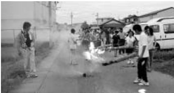
火の付いたたいまつを稲にかざしながら歩く人たち。

【菘村虫送り】 菘村地区で7月13日、虫送りが行われました。この行事は、稲の害虫駆除のために始められたものとされていますが、はっきりした起源は不明ということです。公民館に集まった住民は、各家の麦わらで作られたたいまつに火を付けた後、ホラガイと鐘鼓を先頭に、たいまつを持った子どもたちが稲田の上を火をかざしながら、行列をつくり鳥墓神社まで歩きました。神社に着く頃には、すっかり日も暮れて、たいまつが幻想的でした。