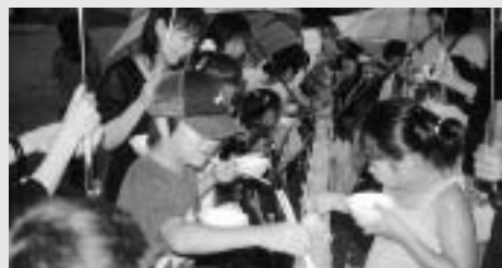
歴史体験館でホタルの放虫会

今後は、皆さんから提案された課題、行政改革を主にして、財政・教育と福祉・環境問題について話し合っていく予定です。