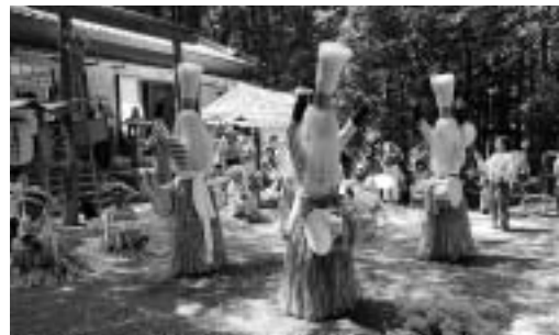
頭に赤熊をかぶり踊る。

有爾中の有爾桜神社で7月16日、羯鼓踊りが行われました。疫病を払い、地区の安全を祈願する行事として、約240年の歴史を持つこの踊りは、頭に赤熊（しゃぐま）をかぶり、棒じまの浴衣に腰みの、腹に白木綿のサラシを巻き、わらじに手甲といういでたちで、羯鼓を抱えて踊ります。夏の蒸し暑い中、大人の中に混じって、羯鼓を抱えた子どもたちや、青い法被を着た幼児らが踊る綾踊りなど、子どもたちの一生懸命な姿に神社に集まった人たちは、目を細めていました。