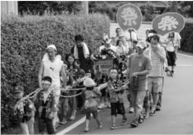
子どもみこしが元気に地区内を回ります。

上村地区で7月8日、天王祭があり、奉納花火や上村自治会子ども会による子どもみこし、出店などが行われました。