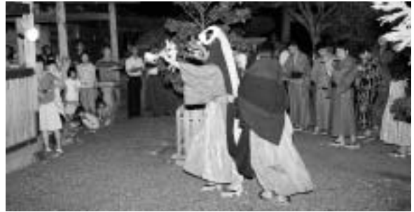
獅子を舞う神楽組の若い衆。

坂本地区で7月14日、天王祭が行われました。この江戸時代から続く伝統行事を受け継いでいるのは、地元の12歳から23歳までの長男で組織されている坂本神楽組の青年たちです。夕方、坂本神社には各家から灯をともした大きなちょうちんを持った人々が大勢集まり獅子舞の始まるのを待ちます。薄暗くなった境内では、神楽組の若い衆が演奏する横笛や太鼓のおはやしに合わせ、獅子舞が「奉納舞」を行い悪魔払いをしました。