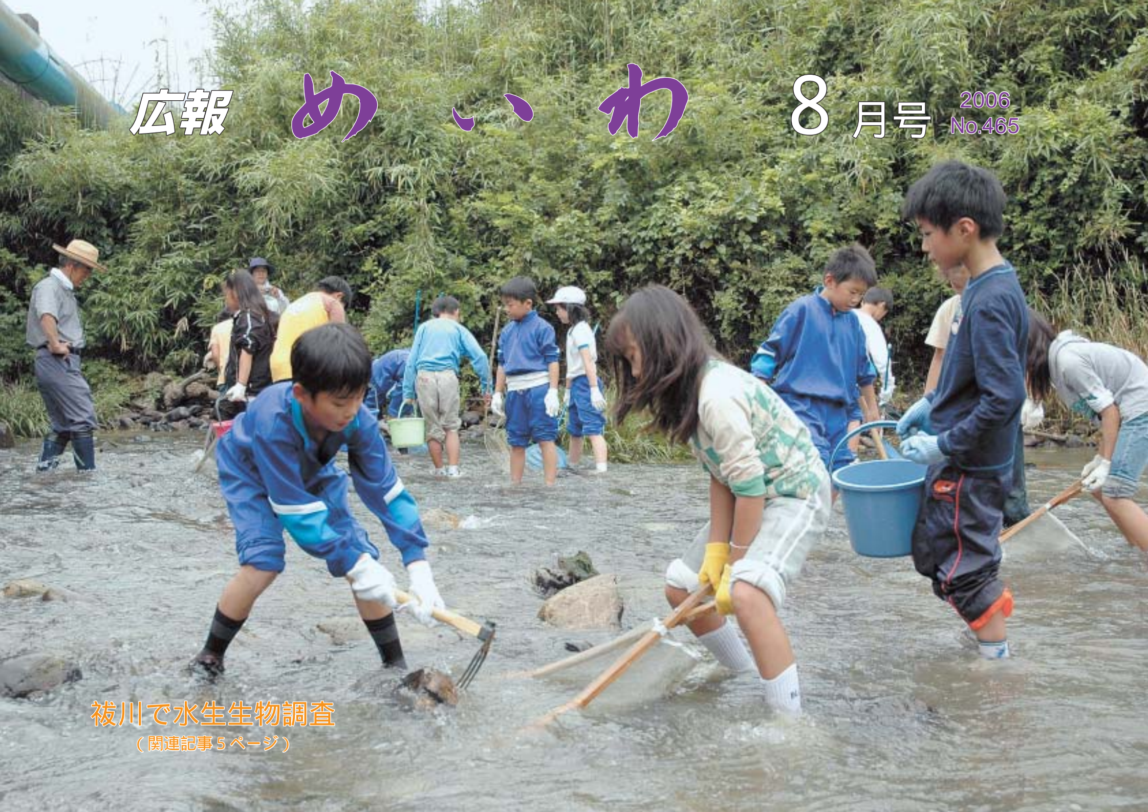
袂川で水生生物調査 (関連記事5ページ)