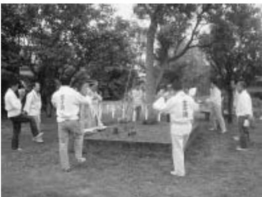
道中宿歌にあわせ、ご神木のクスノキの周りを踊る人たち。

この日は、「富士講」と染めた法被に鉢巻き姿の人たちが、ホラガイを吹きながら「富士参り道中宿歌」を歌い、前野集落センターからご神木のクスノキのある場所まで行列。ご神木にお神酒などを供え、その周りで道中宿歌にあわせて浅間おどりを踊りました。