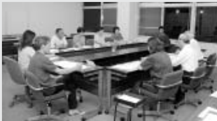
町政モニター会議開催

役場委員会室で6月29日、町政モニター会議が開催されました。第1回目の会議では、10人のモニターさんに委嘱状交付後、自己紹介などを行い、これからの会議の方向性を決めました。