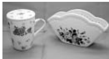
白磁器に模様を転写した完成品。

円(家族参加者追加1人につき100円増) 申込方法 9月19日(火)までに必着(往復はがき)