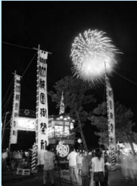
山車の後方に上がる花火。

江戸時代から受け継がれている大淀祇園祭が、7月29日、大淀地区で行われ、勇壮な山車が地区内を練り歩きました。