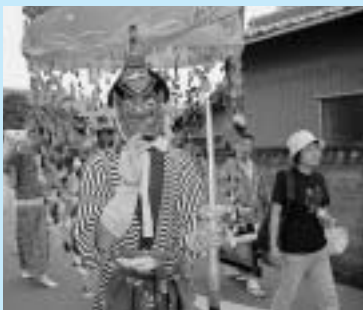
山車の先頭を歩く天狗。

また、夜には同港で花火大会も繰り広げられ、光の芸術が大勢の見物客の目を楽しませました。