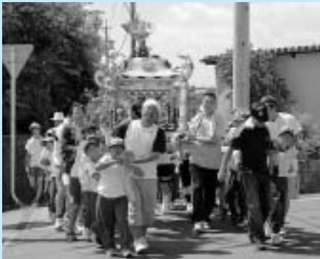
スポーツ少年団の子どもみこし。

園を出発した子どもみこしはスポーツ少年団の子どもの元気な掛け声と共に、地区内を練り歩きました。また、午後には、山車の引き回しが行われ、ケヤキ造りの山車は3時間ほどかけて三世古（西区・北区・中区）を回り、夕方には大淀漁港へ到着。ここでは、この祭りのクライマックスである、山車を2隻の船に乗せて海に浮かべる「海上渡御」が行われました。見事、山車が船に乗ると、周りの見物客から大きな拍手がわき起こりました。