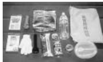
非常用持出袋の中身（例）

そのほか 携帯ラジオ・懐中電灯・マッチ・ライター・電池・包装用ラップ・使い捨てカイロ・防塵（ぼうじん）マスクなど