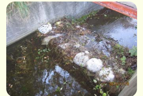
土のうによる洪水吐のかさ上げ

洪水吐に堆積した土砂やゴミ等は、流水断面を阻害し、適切な機能を発揮することができません。また、ため池の貯水を増やすために、洪水吐に土のうを積む様子がよく見られますが、これも危険ですので止めてください。