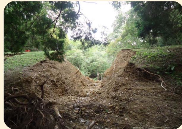
台風による大雨により決壊したため池

ため池は全国におよそ21万箇所あり、古くから農業用水の貯水池として利用されてきましたが、その多くは築造から100年以上が経過し、老朽化が進行しています。さらに、近年多発している局地的な大雨や地震などの自然災害が重なることにより、ため池が決壊し、人命や財産などに大きな被害をもたらす危険性が高まります。