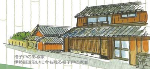
格子戸のある家 伊勢街道沿いに今も残る格子戸の家並