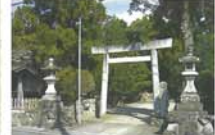
9 竹神社 齋宮内院の跡地に、明治44年に旧齋宮村にあった12社の神を合祀してきた神社。