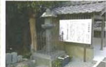
10 六地藏石幢 県指定有形文化財 室町時代後期の作。灯籠ではなく、六面に地藏の姿が刻まれている。