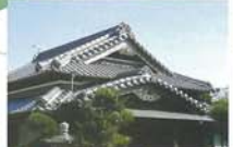
3 御殿 (ごてん) と呼ばれた家 田丸城主 久野氏に仕えた御典医の旧屋敷。