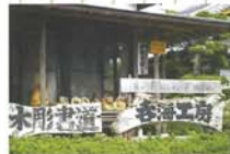
5 呑海(どんかい)工房 明和町まちかど博物館 TEL 0596-52-5576 神宮の桶を使ったカエルや、根付、木彫りを製作展示している。