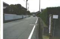
4 そうめん坂 「そうめん坂」は、明星茶屋のかかりに位置し、そうめんやうどんを出す店が何軒か並んでよく繁盛していた。