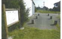
5 八脚門跡 齋宮跡の発掘調査で確認された唯一の門。その規模は神宮の外玉垣御門に匹敵する。