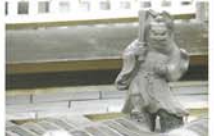
4 屋根の上の鐘植 (しょうぎ) さま 魔よけのために作られた瓦像。