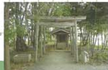
7 庚申堂(こうしんどう) 6本手の青面金剛の姿が庚申様としてまつられている。