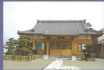
1 安養寺 明和町まちかど博物館 TEL 0596-52-5548 鎌倉時代に創建。県指定文化財(古文書)が多く残っている。