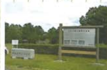
8 史跡水池土器製作道跡 はじき(土師器)製作にかかる土器焼成窯・掘立柱建物・竪穴住居・粘土溜・井戸などが見つかっている。