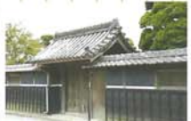
6 江戸時代中期の門 古風な瓦ぶきの門。江戸時代中期の建築である。