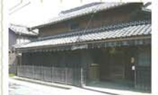
2 雁木の残る家 雁木と格子戸と馬止の3つがそろっている。