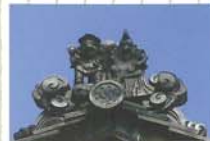
3 鬼瓦に注目! 街道筋では珍しい戒(えびす)・大黒の鬼瓦。