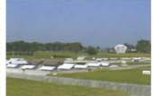
7 史跡全体模型 史跡全体を10分の1に縮小した野外模型。方格地割内に、齋宮の御殿などを復元。