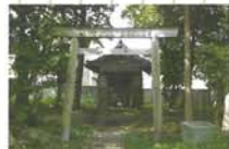
9 御婆堂(おんばさん) この地に祀られた閻魔(十王)さんから起こった名である。