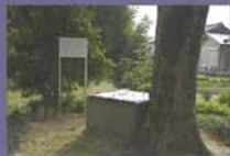
2 明星水 江戸時代参宮者で賑わった明星茶屋の発祥地であり、日本三盞水に数えられたこともある。