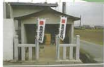
12 弘法さん 伊勢街道が開かれた時代に祀られ、旅人の道中の無事と日々の願い事を祈ったと思われる。