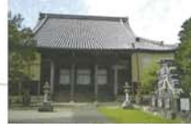
6 転輪寺 明和町まちかど博物館 TEL 0596-52-0829 室町時代の創建で、本教寺といったものを元禄十五年転輪寺と改められた。