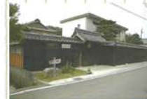
10 三忠(擬萃紙資料館) 明和町まちかど博物館 TEL 0596-52-0701 伊勢神宮参拝客の代表的な土産、伊勢の煙草入れに関する資料を一般に公開している。見学は予約制。