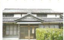
8 明治天皇行幸の家 江戸後期の家で、明治2年～13年の天皇行幸時の休憩に使われた家。