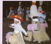
宇爾桜神社かんこ踊り