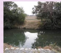
整備箇所(神宮橋跡)

木橋をイメージした神宮橋を整備し、史跡内の散策道かつ生活道路とすることで、区域内の回遊性や住民の生活環境の向上を図る。