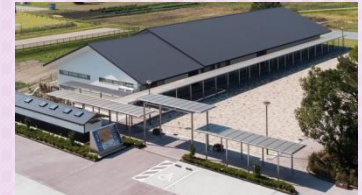
下園東区画広場整備状況

来訪者を受け入れるための案内休憩所や多目的広場、便益施設を整備し、歴史資源の説明を行う拠点や散策の起終点とすることで、歴史的風致を担う地域住民や来訪者の意識向上を図る。