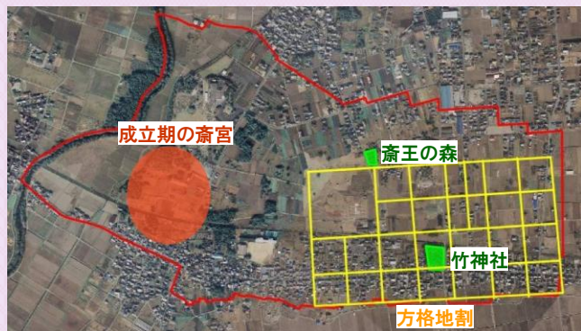
齋宮成立期と方格地割の位置図

齋王制度が廃絶した後、齋宮の旧跡地である「齋王の森」や「野々宮（竹神社）」は、神聖な場所として現在も地元住民に守られ、明治以降の齋宮復興への運動により、史跡指定に繋がりました。地元住民等は往時の隆盛を誇った齋宮の様子を目にすることはできない中で、その姿を皆が思い描きながら、「齋王の森」や「野々宮」を守り続け、ありし日の「齋宮」を思い起こして、市街地に眠る歴史を大切に伝え残すという思いを受け継いでいます。