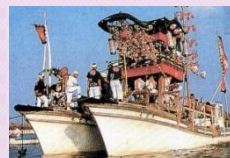
海上渡御(大淀祇園祭)

町内には民俗行事として、大淀祇園祭や宇爾桜神社かんこ踊り等が受け継がれています。こうした行事は、地域の人の手で古くから受け継がれてきており、農村と漁村を舞台として、町民の情熱と地域が一体となった伝統的な祭りの風情を感じさせています。