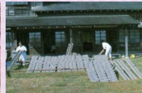
神宮土器の天日干し風景