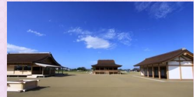
さいくう平安の杜(復元建物)整備状況

柳原区画の最盛期の姿を実物大で復元・表示することで、齋宮らしい雰囲気をもっとリアルに体感でき、そこで生活していた齋王をはじめとする大勢の人々の暮らしを想起させ、歴史的風致を担う地域住民の意識向上を図る。