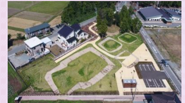
坂本古墳公園整備状況

日本最後の前方後方墳である坂本1号墳のある坂本古墳群を史跡公園として整備することで、歴史的風致を担う地域住民の意識向上を図る。