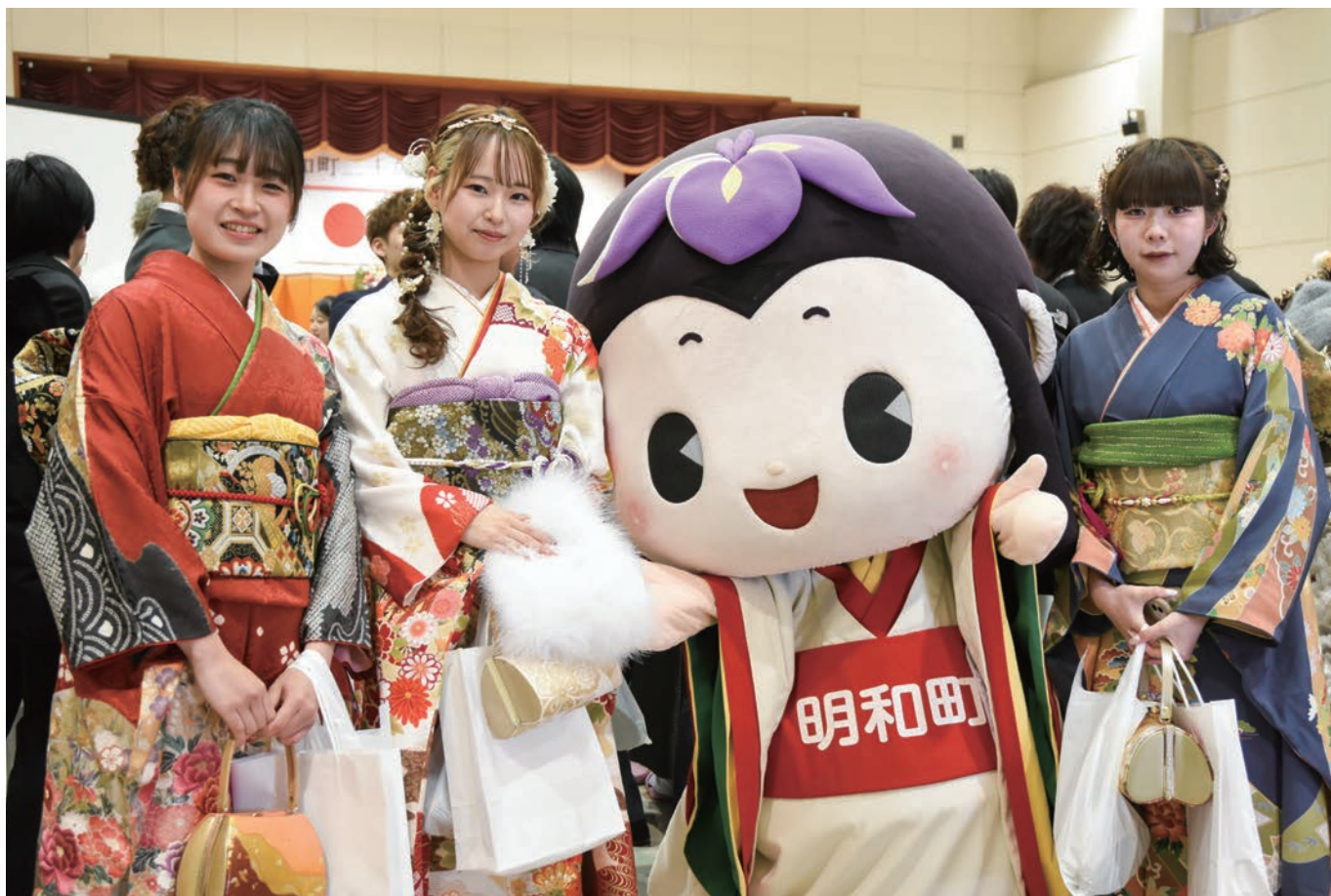
二十歳の集いの様子【詳しくは本紙2ページをご覧ください】