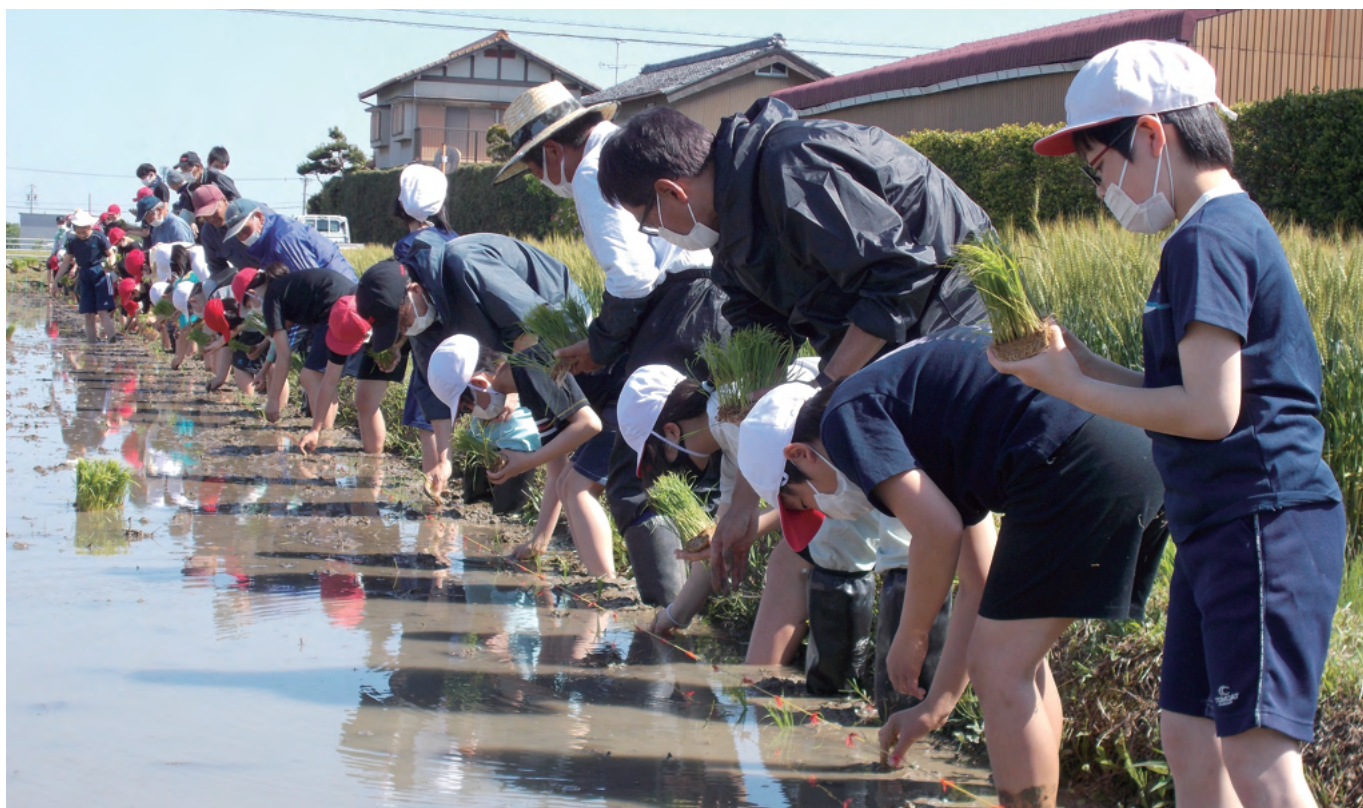
稲作体験学習の様子【詳しくは、本紙2ページをご覧ください】