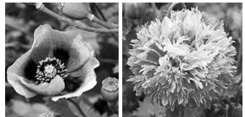
パパヴェル・セティゲルム種