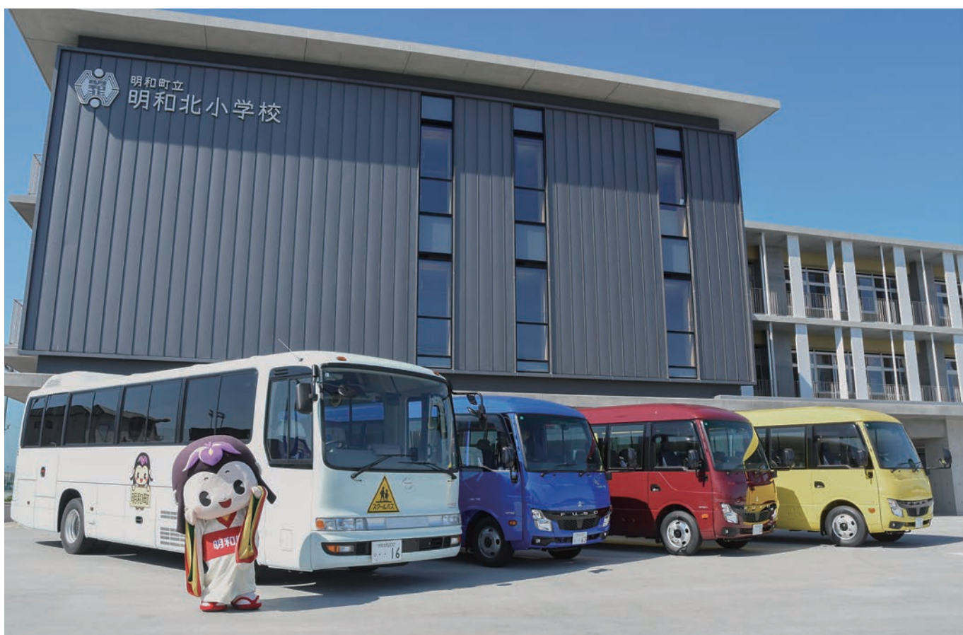
4月から運行の明和北小学校スクールバス