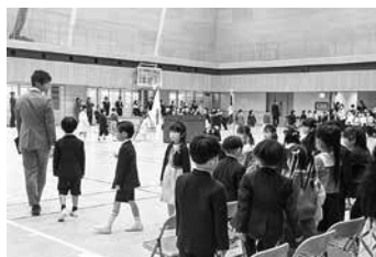
明和北小学校入学式

で行われ、新入生168人が入学しました。新入生と保護者の皆さん、入学おめでとございます。