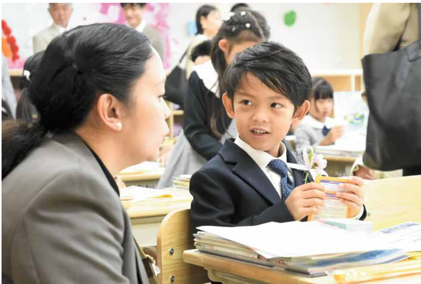
明和北小学校入学式 教室の様子