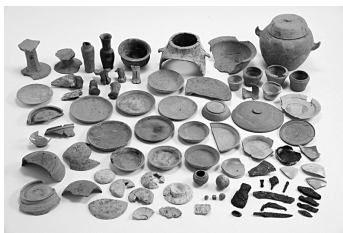
三重県齋宮跡出土品(追加指定分)