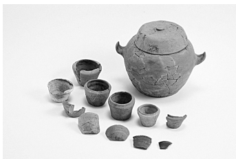
土師器有蓋短頸壺と土師器短頸壺