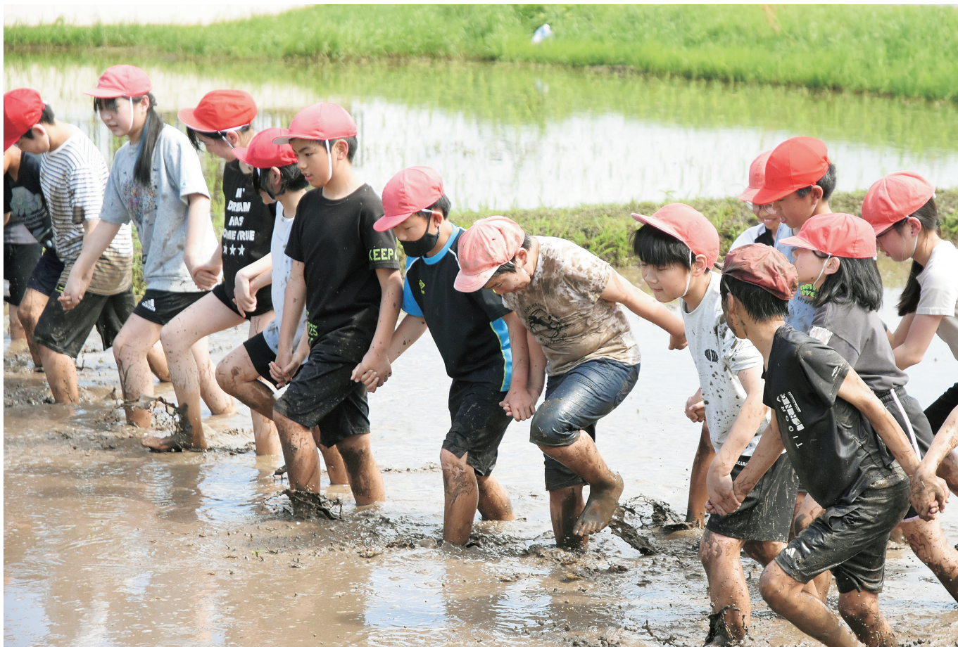
5月7日 明星小学校5年生しろかきの様子