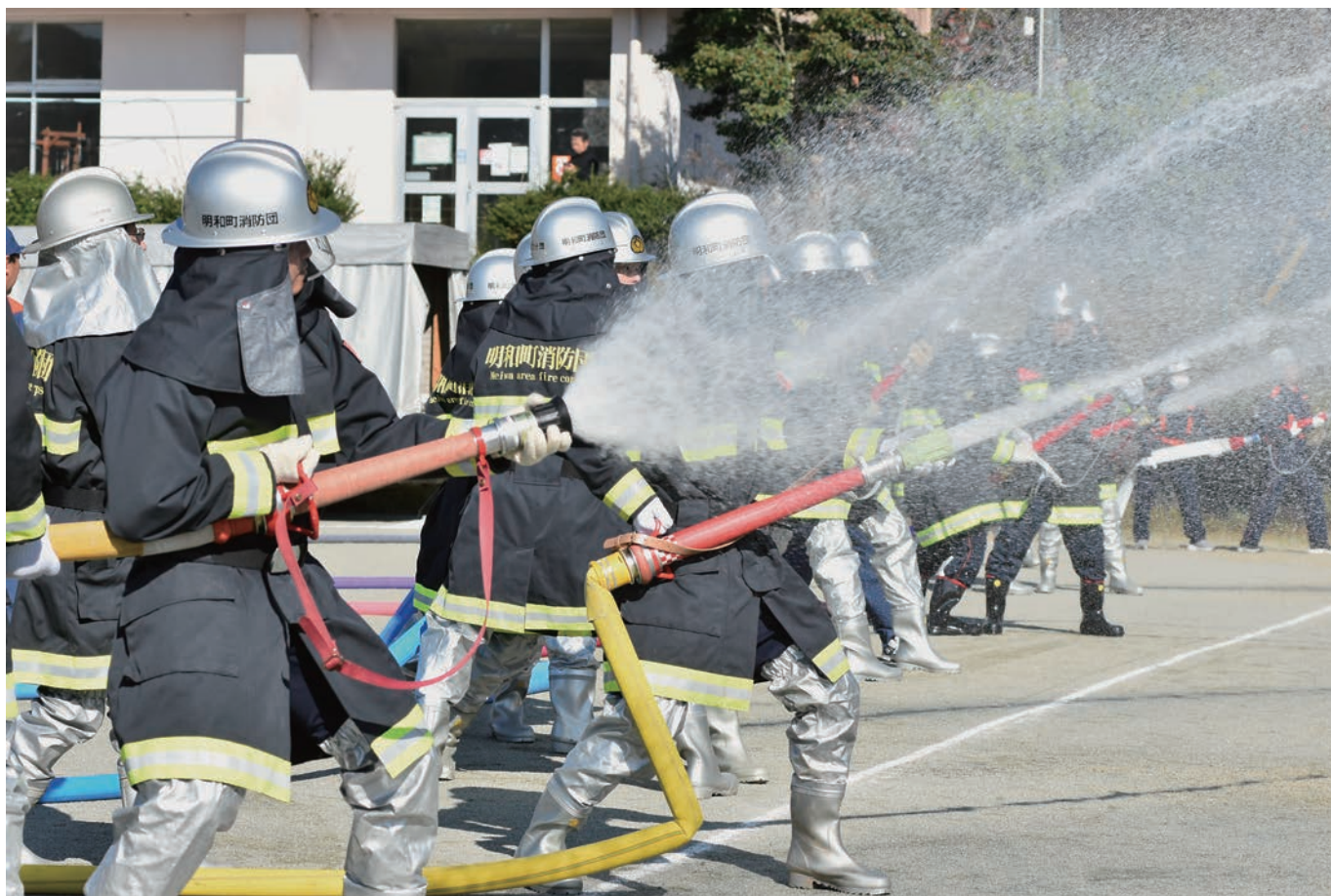
明和町消防団の秋季訓練の様子【詳しくは本紙4ページをご覧ください】