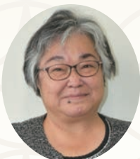
田邊 ひとみ (日本共産党)