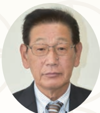
議長 辻井 成人 (無所属)