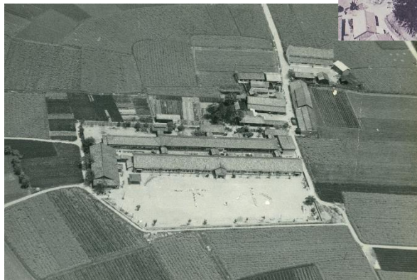
下御糸小学校（昭和28年）