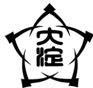
大淀小学校（昭和初期頃か）

昭和33年（1958）に斎明村と三和町が合併して明和町となり、明和町立の6校（大淀小学校、下御糸小学校、上御糸小学校、斎宮小学校、明星小学校、修正小学校）となりました。令和4年度に修正小学校が閉校となり、令和7年度に大淀小学校、上御糸小学校、下御糸小学校の3校が閉校となり、令和8年度から新たに明和北小学校が開校しました。