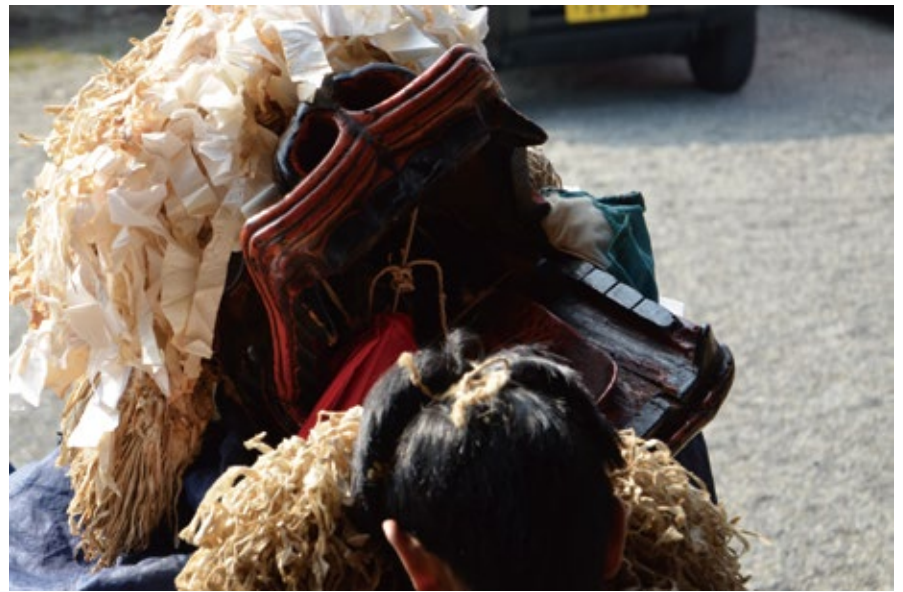
大きく口を開き天狗に迫るオカシラ