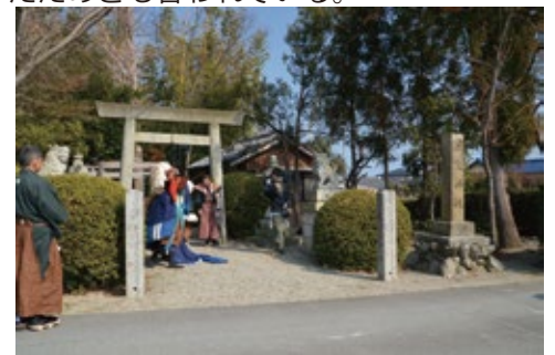
前野神社でも舞が奉納される。

北前野の山ノ神からの帰り道、元池であった田んぼを走り抜ける。これは、池に住む竜神の怒りから逃れるためとも、過去にお頭と天狗が池に落ちたためとも言われている。