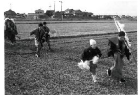
元池を走り抜ける様子

青(濃): ネギサンを世襲する家 青(淡): 毎年オカシラの「オシタ(御舌)」 となる茜を奉納する家 赤: お頭神事に関わる場所