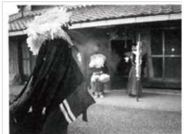
カドマワシ (門舞わし) の様子