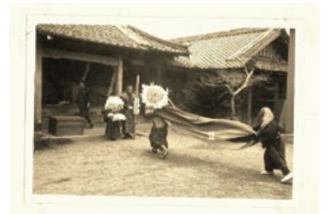
昭和の頃の神事 (詳しい時期不明)

3日目は正念寺境内で「オサメノマイ」が行われ、オカシラを祠に収め神事は終了します。