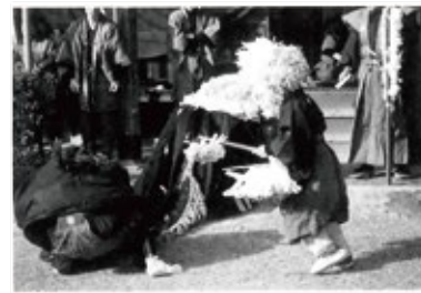
スワリウマ (座り馬) の様子