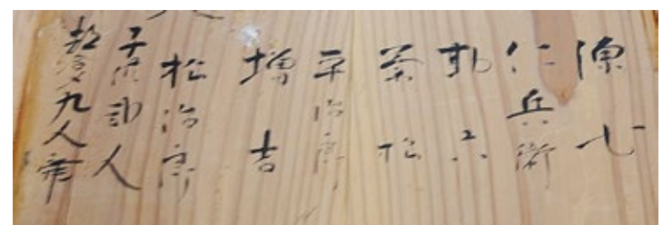
道具箱に書かれた約 200 年前の舞手の名前

*本解説シートは 2015 年 2 月 11 日の見学記録を基に、神事参加者の山崎泰久さんからの聞き取りを加え作成しました。