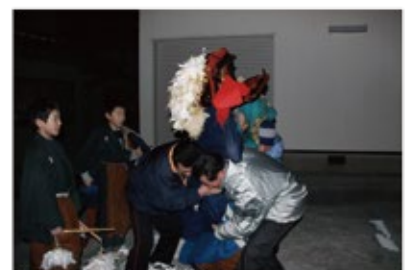
「エベス踊り」でオカシラを押し合うの様子(平成24年)