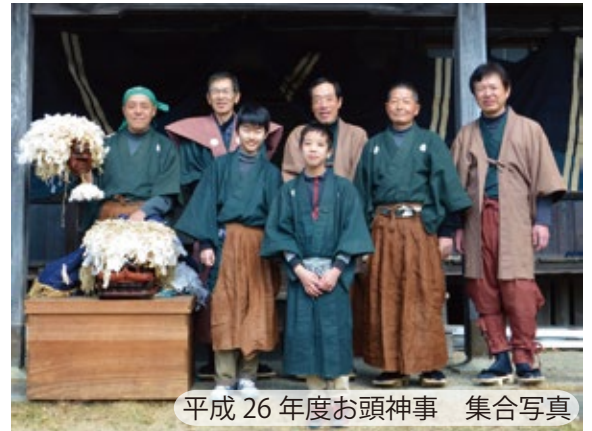
平成 26 年度お頭神事 集合写真

前野のお頭神事は、旧正月 15 日 (現在は 2 月 11 日) に、各家の悪霊を退散させ前野地区の家内安全と豊作を祈願する行事です。昭和 59 年 (1984) 2 月 23 日に明和町の無形民俗文化財に指定されています。