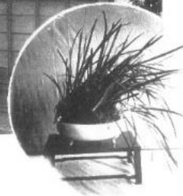
花どんど 村宮齋郡氣多