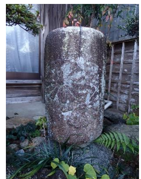
永島家に伝わる菊御紋入りの蹲

これからも「どんど花」という地域固有の呼び方も含め、町の花として大切に守り伝えていきたいですね。