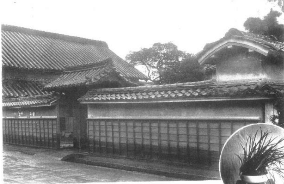
江雪島永 村宮齋郡氣多 所休御皇天治明

齋宮村の永島家には明治2年（1869）と明治13年（1880）に天皇が、明治20年（1887）に 英照皇太后 が休憩を取られ、行幸啓の際にどんど花（ノハナショウブ）を鑑賞された記録が残されています。