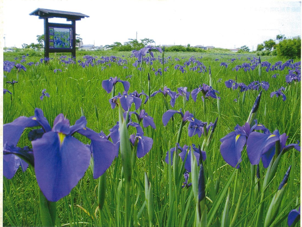
ノハナショウブ開花時期の群落

毎年5月下旬～6月上旬に咲く紫紺の花は、昔の面影を残しながら、訪れる人の目を楽しませてくれています。また、ノハナショウブが終了後、6月～9月にかけてノカンゾウやナガボノワレモコウといったこの辺では珍しい花が咲きます。