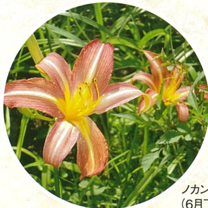
ノカンゾウ (6月下旬～7月下旬 開花)