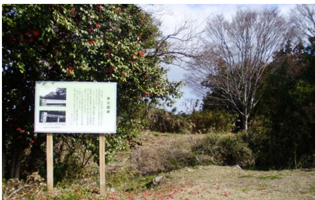
神宮橋の説明看板