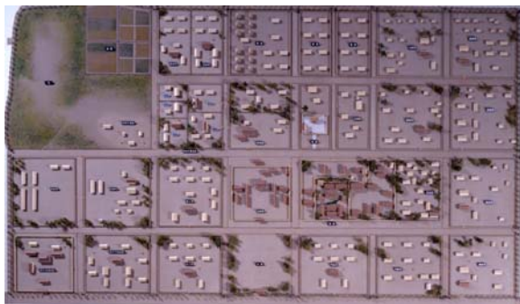
1/400 方格地割模型

斎宮跡が栄えた平安時代初期（約1200年前）には、道路と側溝で区切られた碁盤目状の土地区画が存在していたことが、今までの発掘調査により確認されています。この土地区画を「方格地割」といい、下写真のように碁盤目状に区画が分けられています。一区画が120m四方という大きさを区画され、その区画が東西に7区画、南北に4区画存在していました。方格地割の20余数のブロックに分けられた空間は、さながら官庁街というような風景だったと考えられます。