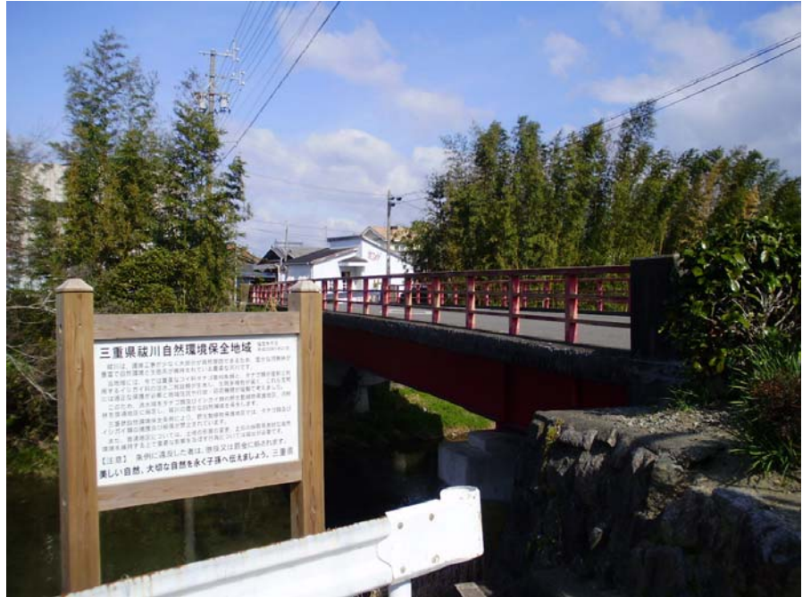
祓川と祓川橋（明和町側から撮影）

し、それぞれ橋銭（はしせん）や舟賃を徴収していました。その昔、祓川の渡して参宮客が流される事故があり、その時に流された参宮客を金剛坂の人が葬り、供養したという物語が地域に語り継