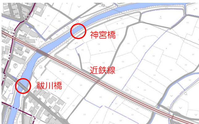
祓川橋と神宮橋の位置図

明和町では、両岸に説明看板を設置しています。神宮橋が復元されるまでの間、当時どのような橋だったのか、訪れていただいた皆さんにイメージしていただければと考えています。