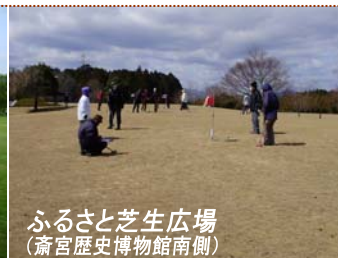
ふるさと芝生広場 (斎宮歴史博物館南側)