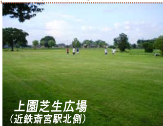
上園芝生広場 (近鉄斎宮駅北側)