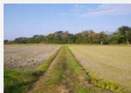
散策道整備予定箇所の現状

来訪者等が散策できる回遊ルートを整備し、また、祓川には木橋をイメージした神宮橋の整備を計画しています。史跡内の散策道かつ生活道路とすることで区域内の回遊性や地域住民の方々の生活環境の向上を図ります。