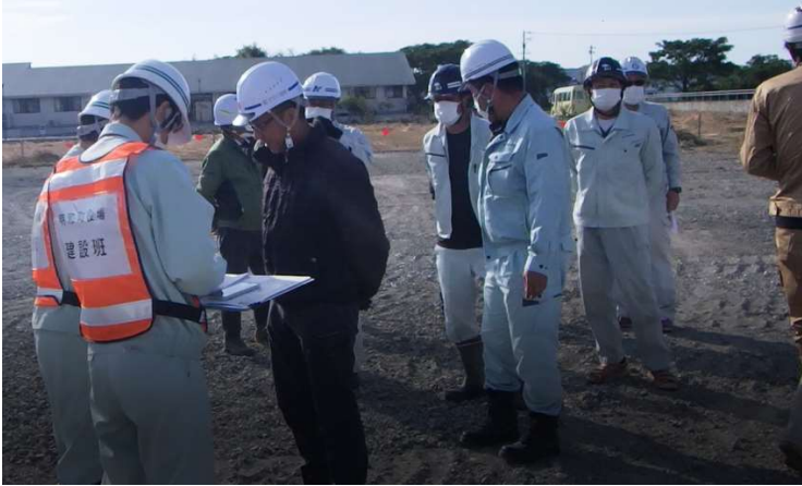
訓練参加者参集状況 (参加事業者 11 事業者 参加人数 15 名)