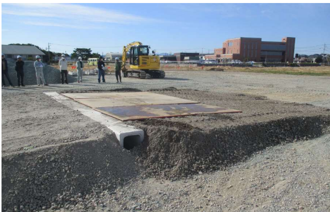
敷き鉄板敷設完了