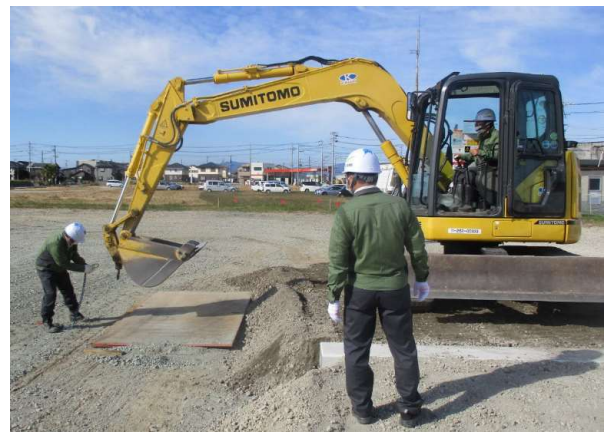
敷き鉄板敷設開始