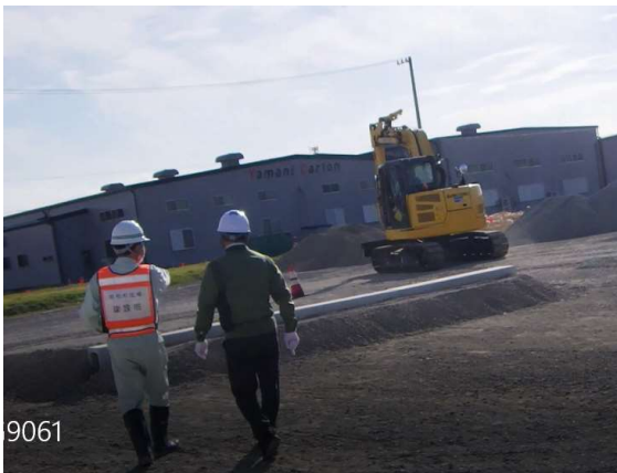
道路状況確認中 (段差)