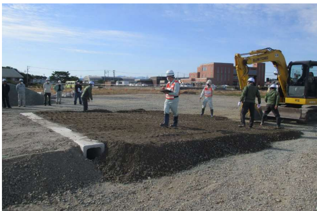
土砂敷均し状況完了確認中