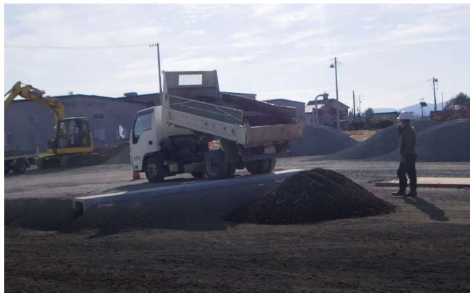
道路段差啓開作業開始 (土砂搬入)