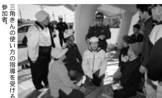
三角きんの使い方の指導を受ける参加者。