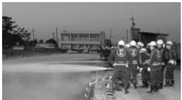
一斉放水の様子。（大淀漁港）

同日、消防団の秋季訓練が総合グラウンドで行われ、消防団員150人が参加しました。この訓練では、各個・小隊訓練や中隊訓練、機械器具点検、体力錬成として分団對抗綱引きが行われました。一系も乱れない各訓練からは、消防団員の防災に対する意気込みが感じられました。