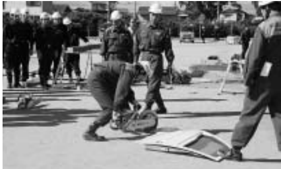
消防団員にチェーン・ソーの使い方を説明する明和消防署員。