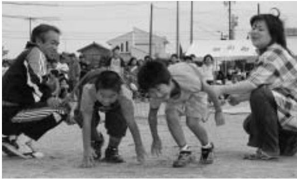
ネットをくぐるのは難しい。