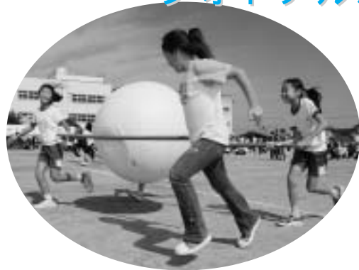
気持ちをひとつにして大玉運び。