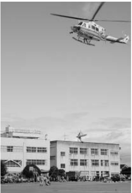
防災ヘリコプターで要救助者の搬送作業の様子。