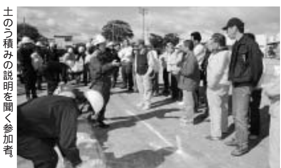
土のう積みめの説明を聞く参加者。