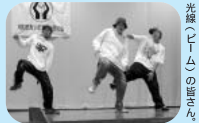
光線(チーム)の皆さん。