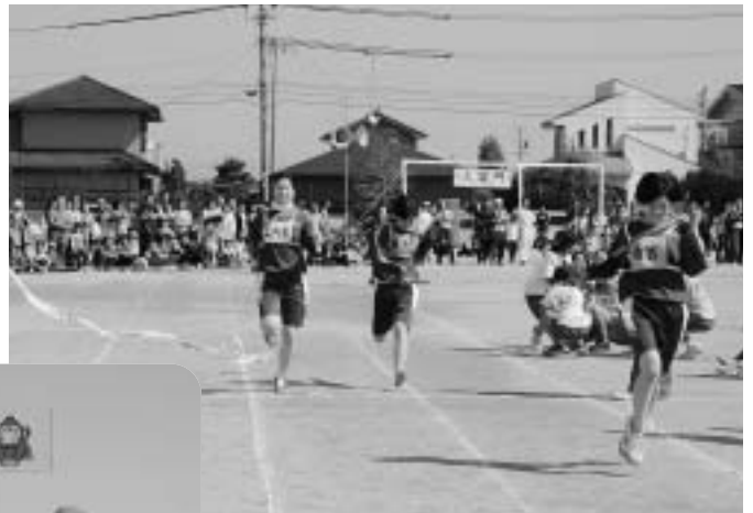
中学生女子リレーは斎宮が1位でした。