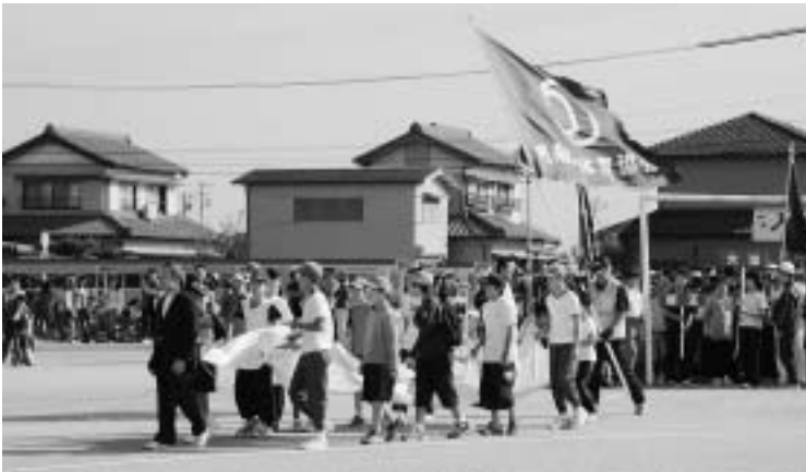
ドキドキわくわく入場行進。

早朝の雨も上がりさわやかな秋晴れとなった10月16日、明和スポーツまつりが明和中学校のグラウンドで開催されました。