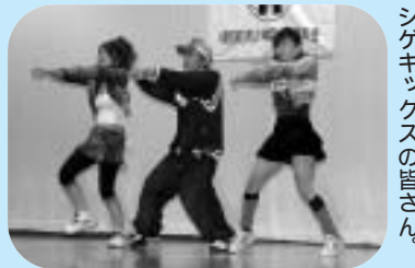
シゲキックスの皆さん。