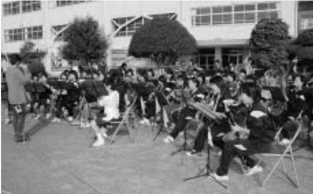
明和中学校吹奏楽部の皆さんごろうさま。