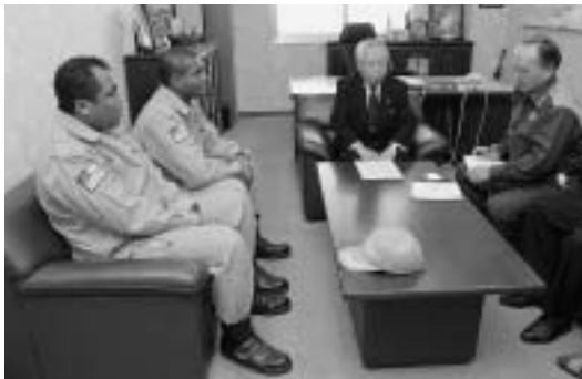
ファイジーの消防署員が明和消防署で技術実務研修