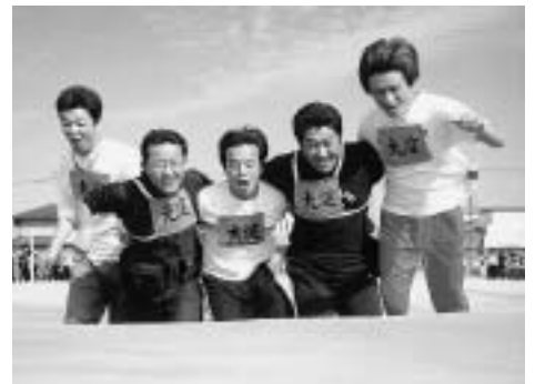
マットに倒れ込む5人6脚競争のお父さんたち。