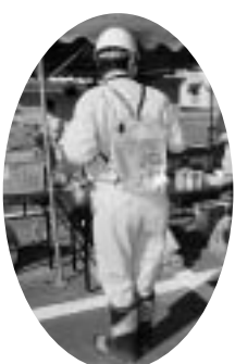
リユクク式の非常用飲用水袋。