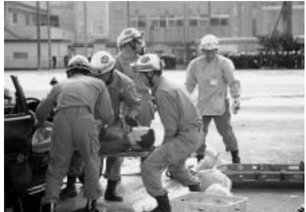
事故車からの救出の実演をする松阪消防署レスキュー隊員。