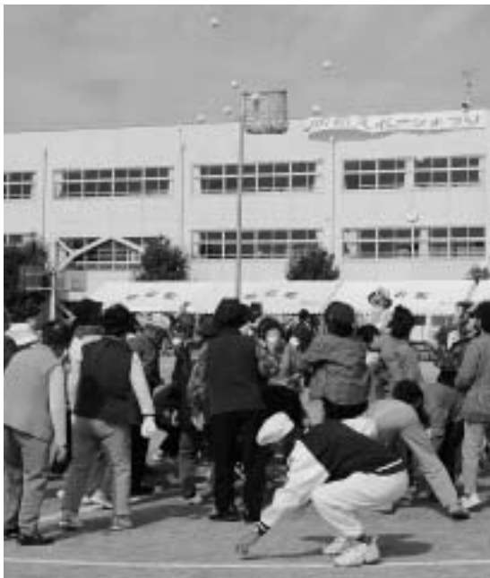
元気いっぱい、老人クラブ連合会の5色玉入れ。