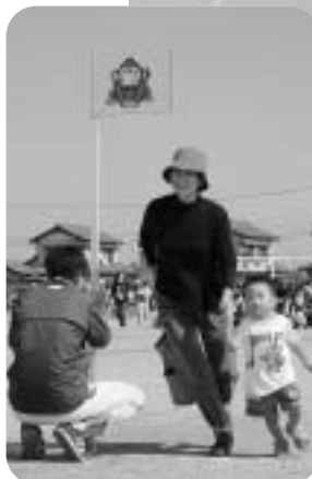
お母さんと一緒に駆けっこ。