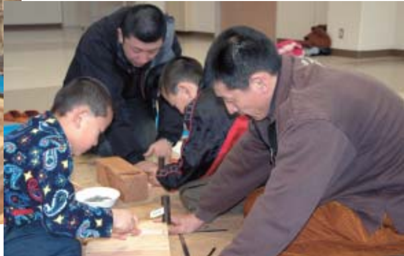
親子でつくる木工教室（関連記事5ページ）