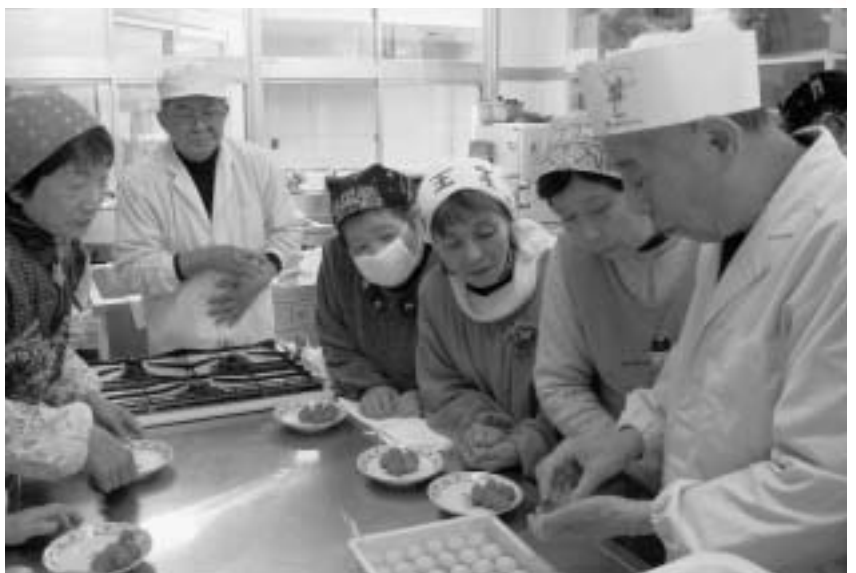
イチゴを白あんでくるみ、もちで包むと「いちご大福」の出来上がり