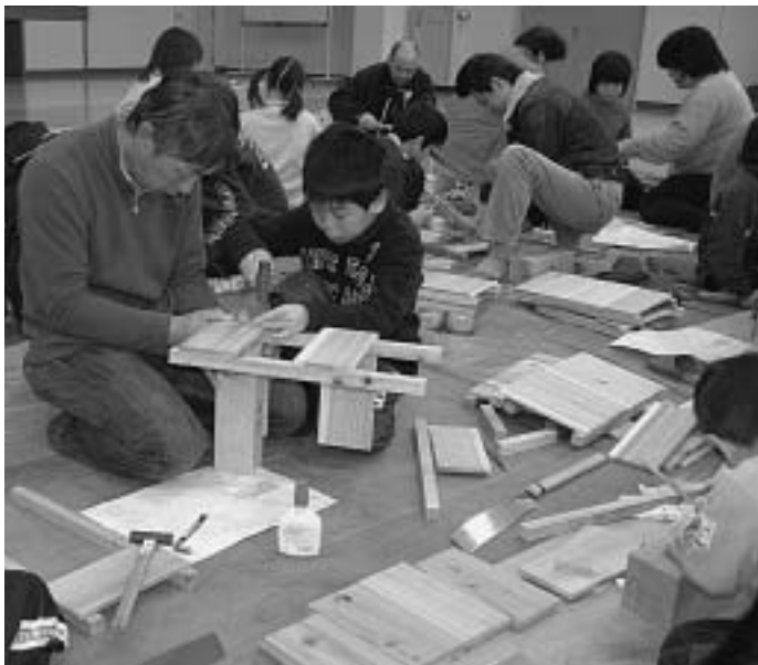
親子で力を合わせてごみ箱作りに挑戦