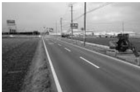
自歩道整備の工事が進む広域圏道路（町道前野・川尻線）

町の行政改革について、詳しくは行財政改革推進室（☎52・7110）へお問い合わせください。