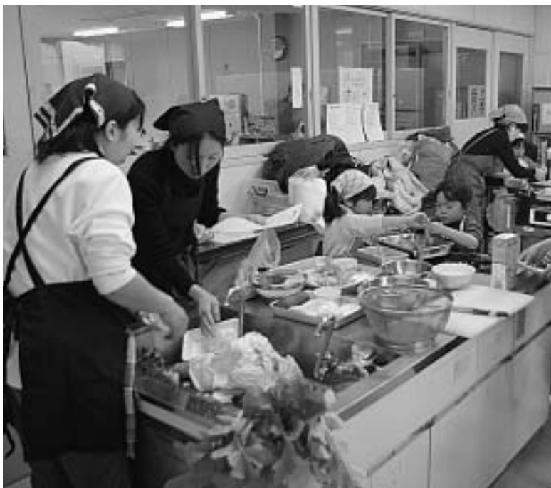
収穫した野菜を自分たちで料理

2月16日の教室最終日、この日はダイコンやキャベツなどの収穫の後「食育げんきッズ」の皆さんを講師に招き、中央公民館の調理室で、冬野菜の料理教室が行われまし