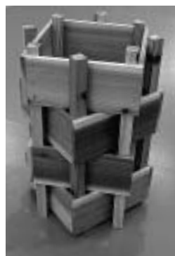
出来上がったごみ箱。傘立てなどにも使えますね

から真つすぐ打つんだよ」とお父さん。「板が曲がついてるよ。しっかり押さえてよ」と子どもたち。和やかな会話が弾む中、「トントントン」とくぎを打つ音が、心地よく会場に響いていました。