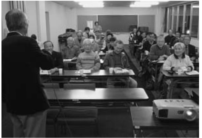
裁判員制度について懇談

2月1日の夜、明和町人権を守る会の懇談会が、町中央公民館で行われました。懇談会には、同会の会員のほか、自治会の皆さんなど約30人が参加。津地方検察庁の職員を講師に招き、平成21年の春からスタートする「裁判員制度」を学習しました。最初に、法務省の広報ビデオ「裁判員制度について、もしもあなたが選ばれたら」を鑑賞。その後「裁判員の選定