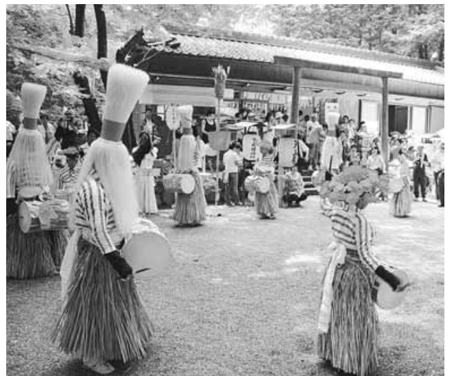
独特のいでたちで踊る羯鼓(かんこ)踊り

7月13日、有爾中の宇爾桜神社で、有爾中地区に伝わる伝統行事、羯鼓(かんこ)踊りが行われました。