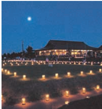
前年の十五夜観月会