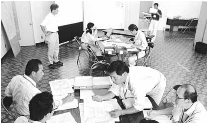
図上防災訓練の様子

午前8時に熊野灘沖を震源とするマグニチュード8・3の地震が発生したという想定で、災害対策本部を設置。職員が訓練進行者（コントローラー）と訓練参加者（プレイヤー）に分かれ、プレイヤー側は、災害対策本