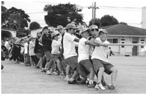
前年の明和スポーツまつりの様子