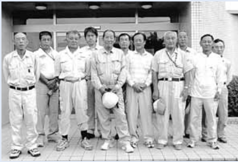
明和ブロック電気工事組合の皆さん