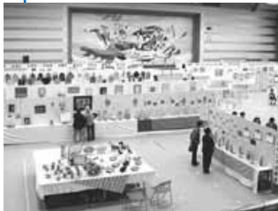
前年の町民文化祭作品展示

■とき 11月1日(土) 午前9時～午後4時、 11月2日(日) 午前9時～午後3時 ■ところ 総合体育館