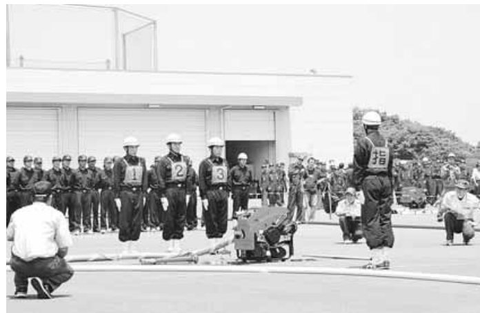
小型ポンプ操法の競技を開始する選手の皆さん

この大会は、県内消防団の技術向上と士気の高揚を図るもので、一年おきに開催されています。