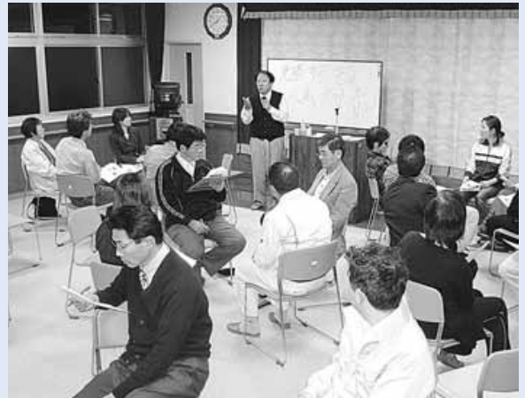
前年の連続人権講座の様子