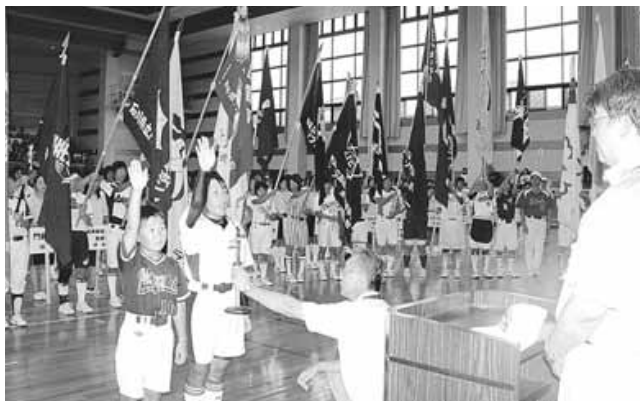
開会式で選手宣誓を行う選手たち