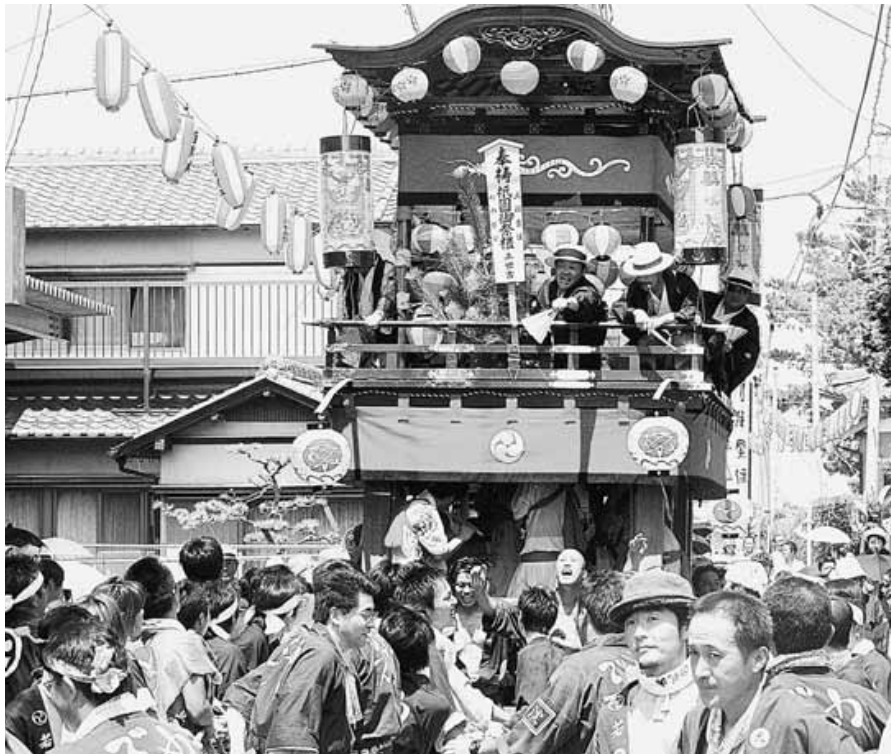
勇壮な山車の曳(ひ)き回し

7月26日、大淀地区で大淀祇園祭が開催され、子どもみこしや山車の曳(ひ)き回し、海上渡御(とぎよ)、夜には花火大会が行われました。これは、江戸時代から25