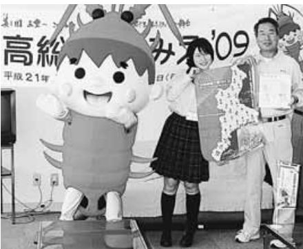
役場を訪れたキャラバン隊