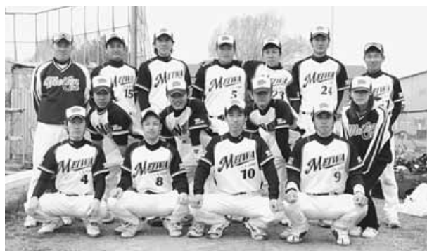
明和クラブの皆さん