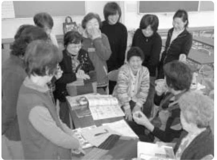
皆さんの笑顔が絶えないパッチワーク同好会の活動の様子(1月26日、中央公民館で)

必要なる材料費などは各自に負担していただきます。 ■申込方法 別途各世帯に配布する「講座募集案内チラシ」をご覧ください。 ※同時に各同好会の会員も募集します。詳しくは、中央公民館(☎52・7132)へお問い合わせください。 4月21日に 公民館講座開講式 開講行事には一般の 皆さんもぜひご参加を 明和町中央公民館では、平