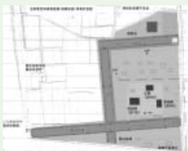
事業計画図（斎宮歴史博物館提供）

【史跡斎宮跡東部整備事業】史跡斎宮跡東部整備事業は、歴史価値の高い斎宮跡の魅力をもっと高めていくため、