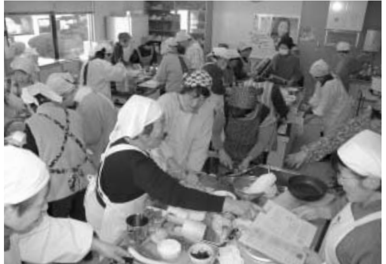
食生活改善推進協議会会員の指導の下、伝統料理作りに取り組む皆さん

明星地区では年2回の料理講習会のほか、地域のお年寄りを招待する食事会も定期開催するなど、幅広い活動を展開しています。 「伝統料理」をテーマとしたこの日の講習会には、地域の主婦の皆さんなど17人が参加。三田地区代表から料理の説明を受けた後、黒豆ごはんやパリパリーなます、たけしろう汁、さつま芋の茶巾しぼりなど5種類の料理作りに取り組んでいました。