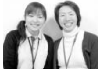
専門の相談支援員が支援等を行っています

福祉センター内、☎52・7127、☎52・7128、✉shien@town.meiwa.mie.jp）へお問い合わせください。