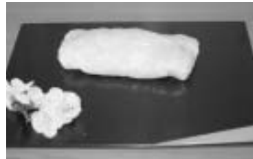
昇進祝いの宴のごちそう・餅談