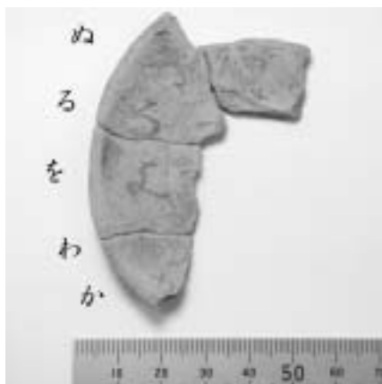
墨書土器破片の内側（写真上）と外側（写真右）。

これまで、いろは歌が墨書された平安時代の土器は見つかっていません。また、木簡（もっかん）も12世紀後半以降のものしか確認されていないことから、斎宮跡から出土したものが、平仮名のいろは歌としては日本最古のものと判断されました。