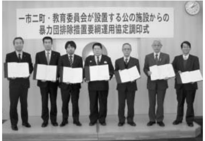
調印式に出席した関係者の皆さん

1月31日、松阪警察署と明和町など所轄市町等による「公の施設からの暴力団排除措置要綱運用協定」締結の調印式が松阪警察署で行われました。 この協定は、明和町・松阪市・多気町の「公の施設からの暴力団排除措置要綱」の規定に基づき、松阪警察署と各所轄市町・教育委員会等の連携強化（情報提供、不当介入時の通報と協力、措置の連携等）を図るものです。