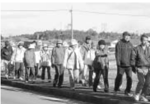
健康ウォークの様子

■場所 明和町保健福祉センター ※詳しくは、産業課企業誘致商工観光係(☎52・7138)へお問い合わせください。