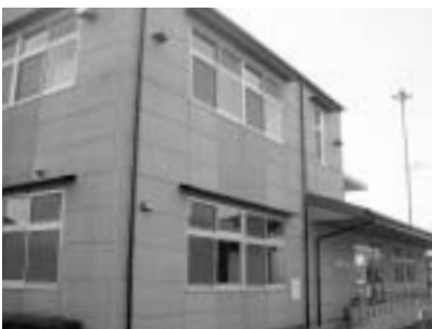
明和町人権センター

の申込期間中、各日とも午前9時～午後5時に直接、電話またはファクスで人権センターへ申し込んでください。1人の申し込みにつき1人分の参加を受け付けます。詳しくは、人権センター(☎・FAX)ともに55・3052)へお問い合わせください。