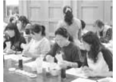
これまでの練香づくり体験の様子

京都の香老舗「松栄堂」から講師を招き、お香の話で歴史を学び、香木などの天然香料を使って練香(ねりこう)づくりを体験します。参加の際は事前の予約が必要で、先着順で受け付けます。