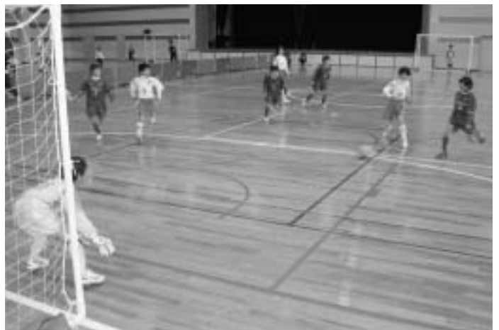
熱戦を繰り広げる子どもたち