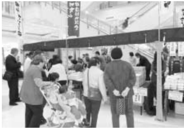
これまでの明和ざいしょ市の様子

※詳しくは、明和町特産品振興連絡協議会(明和町観光協会内、☎52・0055)へお問い合わせください。