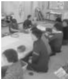
おしゃべりサロン