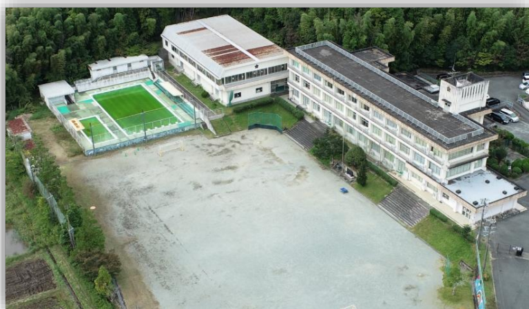
修正小学校：令和5年3月閉校予定 (三重県多気郡明和町大字有爾中816-1)