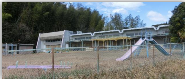
旧暁幼稚園 (三重県多気郡明和町大字有爾中985-1)